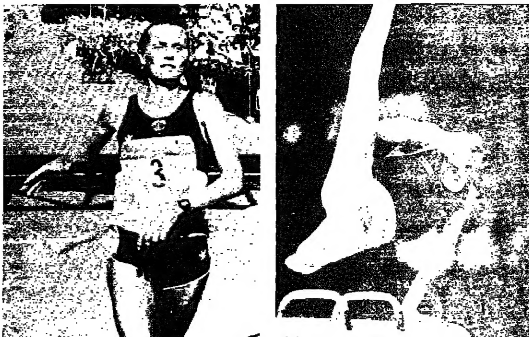
السوفياتى يوتغيني غل حصل الذهب (رويترز) السوفياتية ايفانوفاجيتزل خط النهاية لسباق الماراتون (رويترز)